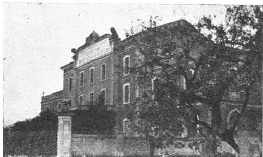
Molino Pagano in Gioia del Colle