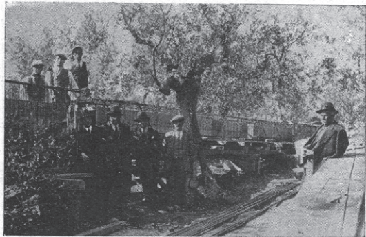
Opera costruita in Molfe (fognatura) 1933-1934