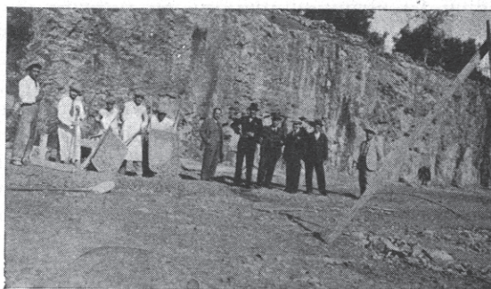
Escavo della vasca di decantazione in Andria (1933-34)

10.) Costruzione della Cabina di trasformazione della Società elettrica nel Comune di Andria.